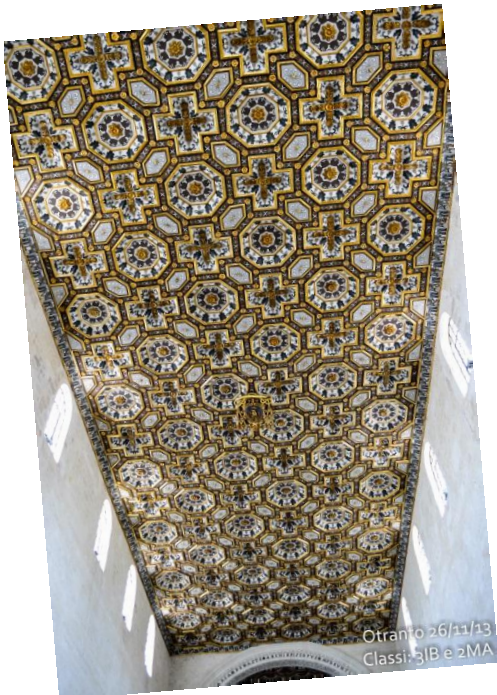
Il soffitto della Cattedrale