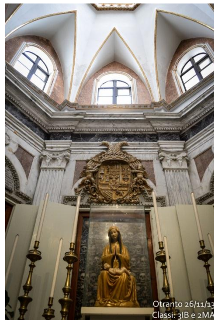
Otranto 26/11/13 Classi: 3IB e 2MA