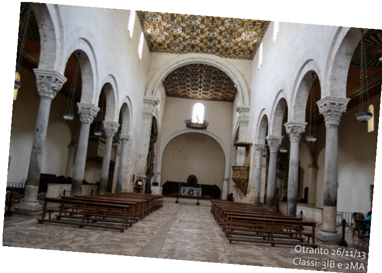
L'interno della Cattedrale